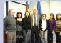
Pág. 8 - Web Social

Alumnos destacados fueron homenajeados por la Universidad de Concepción.