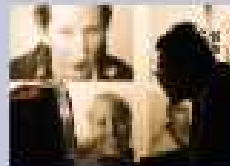
Pág. 7 - Opinión

Ideas innovadoras, una de ellas: "Webperioderos".