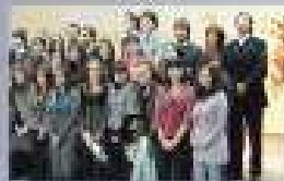
Pág. 6 - Crónica

Nuevos periodistas de la Universidad de Concepción ingresan al mercado laboral.